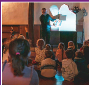
Spectacle "La Maison la nuit".