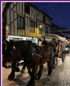
Balade en calèche.